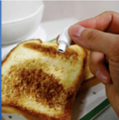
Catch Toast Flavor