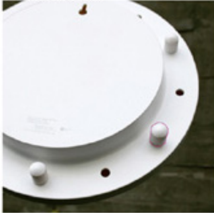
Backside of Clock