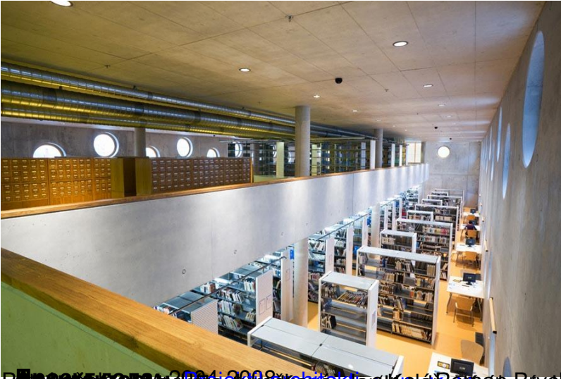
Библиотека в Градце Карлове, Австрия, архитекторы: Kuba Bonar, Borchardt, Aca Petal, Ondrej Hofmeister, by www.architectonica.com , www.architectonica.com/admin/architecture/researchlibrary , width=[100], height=[100]